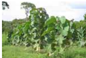
Teca de 8 meses