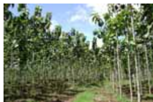
Teca de 2 años