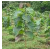
Teca de 7 meses