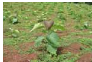
Teca de 5 meses