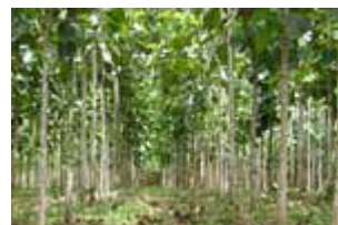
Teca de 3 años

ecoBosques únicamente realiza plantaciones en tierras de las más fértiles del mundo , con climas tropicales y subtropicales. Siendo las precipitaciones anuales medias de las plantaciones de Costa Rica de 3.000 mm. anuales, con temperaturas superiores a los 25°C. Aprovechando estos ecosistemas muy propicios para el desarrollo de las plantaciones, se obtienen árboles de teca entre 7 y 8 metros de altura entorno al año de ser plantados, midiendo 14 metros de altura a los 3 años y 13,5 centímetros de diámetro(grosor DAP) . Es reconocido que la producción forestal en países de climas tropicales y subtropicales es mucho mayor , donde las especies en general presentan un potencial de crecimiento relativamente rápido, rotaciones más cortas y por tanto unos ingresos esperados mucho mayores .