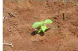
Teca de 1 mes