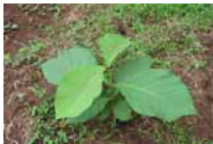
Teca de 3 meses