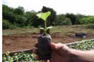
Plantín a los pocos días