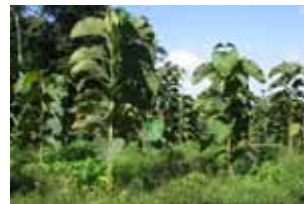
Teca de 9 meses