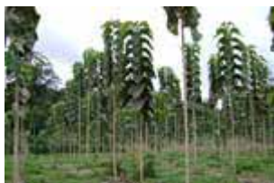
Teca de 1 año