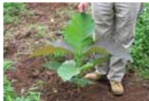
Teca de 4 meses