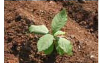
Teca de 2 meses