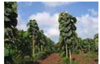
Teca de 10 meses