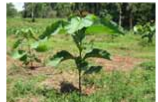
Teca de 6 meses