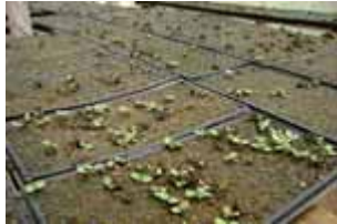
Germinación de Teca